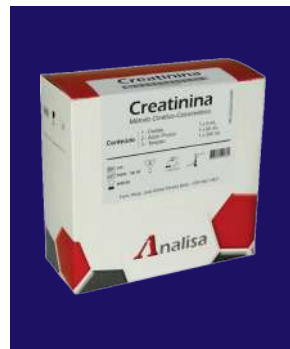
CREATININA - REF 435