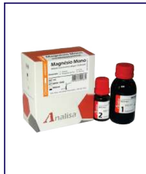
MAGNESIO MONO - REF 115