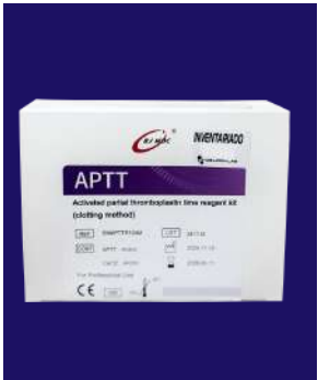
TTPA 5x4ml - BSBE