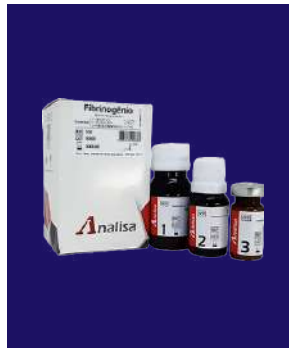
FIBRINÓGENO - REF 116