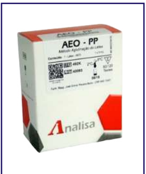
AEO LÁTEX - REF 541E