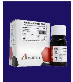
AMILASA DIRECTA CNP – REF 407