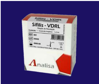
VDRL – REF 129