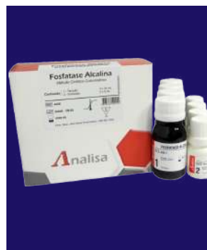
FOSFATASA ALCALINA - REF 440