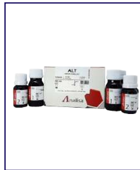
ALT – REF 109