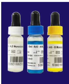
ABO (MONOCLONAL) – REF 172