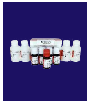
UREA - REF 416