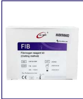
Fibrinógeno 60ml - BSBE