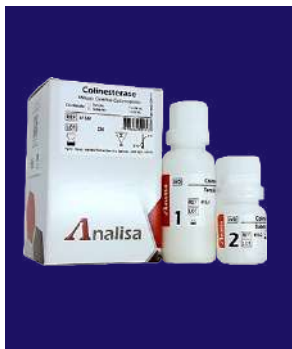
COLINESTERASA – REF 415