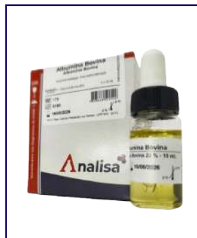
ALBUMINA BOVINA 22% - REF 173