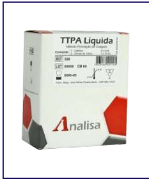
TTPA LÍQUIDA - REF 556