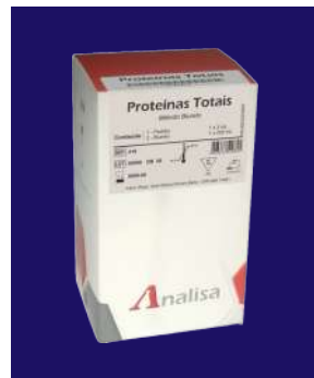
PROTEÍNAS TOTALES - REF 418