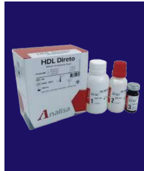
HDL DIRECTO - REF 400