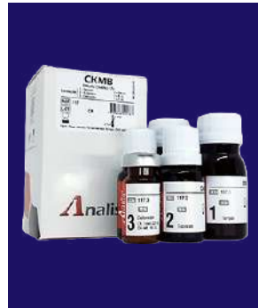
CK MB – REF 222