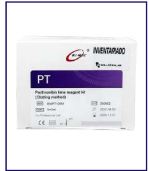
TP 5x4ml - BSBE