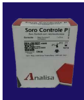
SUERO CONTROL P - REF 498