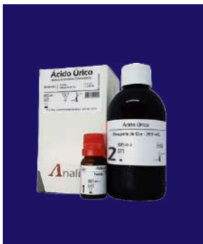
ÁCIDO ÚRICO - REF 451