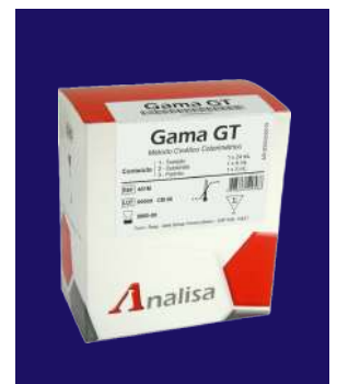
GAMA GT - REF 108