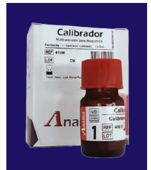
CALIBRADOR – REF 410