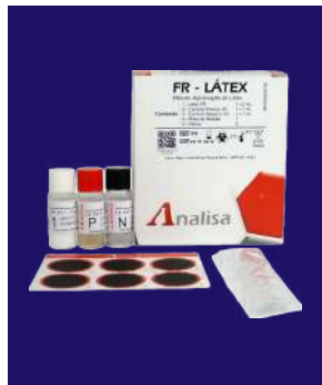
FR LÁTEX - REF 542E