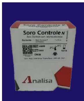
SUERO CONTROL N - REF 497