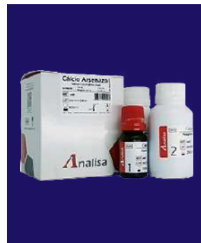
CALCIO ARSENAZO – REF 449