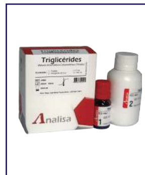
TRIGLICÉRIDOS - REF 459