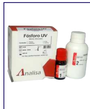
FÓSFORO UV - REF 412