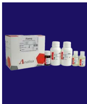
HIERRO – REF 438