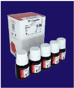
TP LÍQUIDA - REF 555