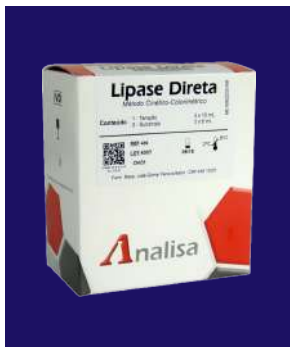
LIPASA DIRECTA - REF 409