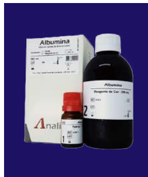
ALBUMINA – REF 419