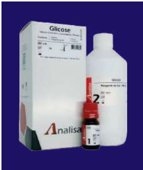
GLUCOSA - REF 112