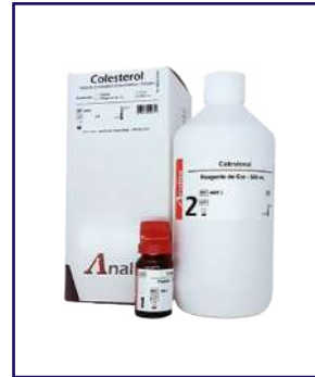
COLESTEROL – REF 111