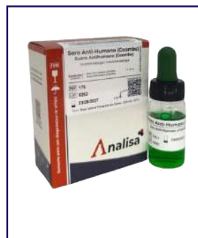
SUERO ANTI-HUMANO (COOMBS) – REF 176