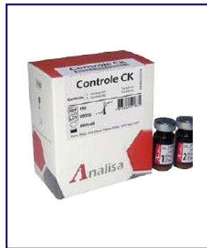
CONTROL CK – REF 118