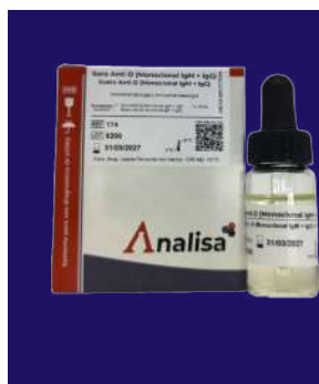
SUERO ANTI-D (MONOCLONAL IGM + IGG) – REF 174