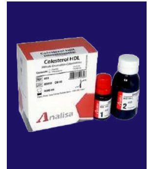
COLESTEROL HDL – REF 413