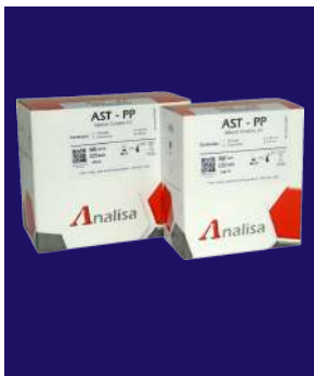
AST – REF 105