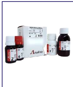
BILIRRUBINAS DCA – REF 431