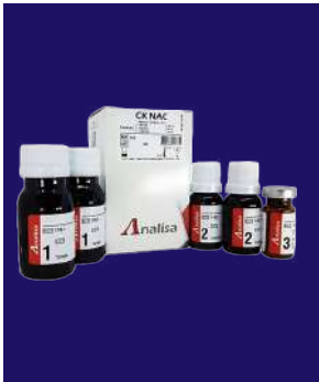
CK NAC – REF 221