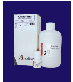
CREATININA MONO - REF 110