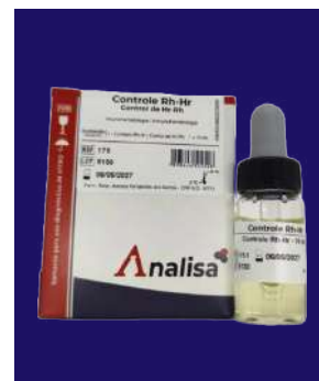
CONTROL RH-HR – REF 175