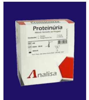
PROTEINURIA - REF 498