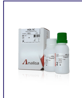
HDL SC - REF 114