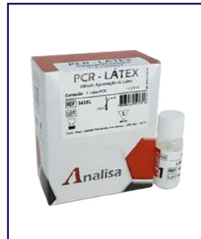
PCR LÁTEX - REF 543E